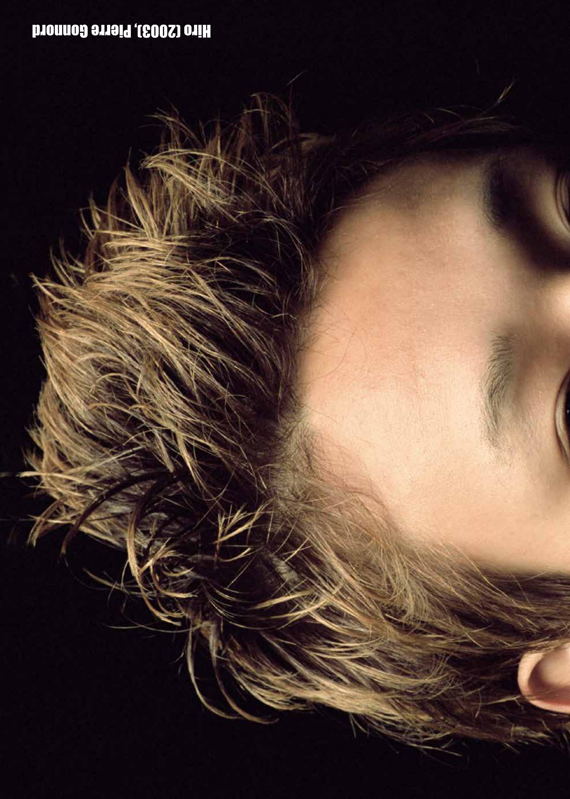
Hiro (2003), Pierre Gonnord